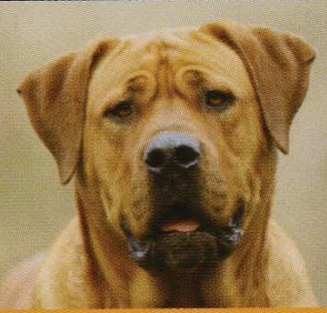
• Tosa (lof)