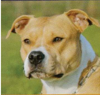
• American Staffordshire terrier

Chiens inscrits au LOF, donc avec pedigree, de race : Chiens LOF ou non LOF, de race :